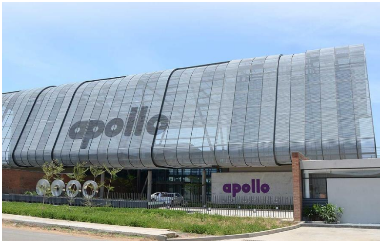
Abbildung 1: Apollo Tyres verfügt über zwei modern ausgestattete, globale Forschungs- und Entwicklungszentren. Das R&D Center in Enschede (Niederlande) ist Dreh- und Angelpunkt für Tests und Entwicklungen zukunftsweisender Markenreifen in Europa und Amerika. Das Zentrum in Chennai (Bild) ist für die gesamte Region Asien-Pazifik, den Nahen Osten und Afrika zuständig.

Bildmaterial zur freien redaktionellen Verwendung, mit Angabe der Bildquelle: Apollo Tyres®.