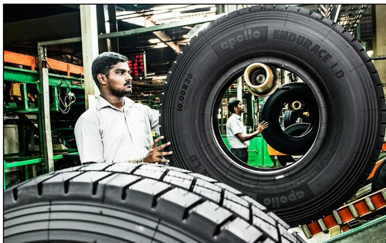
Abbildung 2: ENDURANCE Lkw-Reifen von Apollo sind erwiesenermaßen außergewöhnlich langlebig. Alle Lkw-Reifen haben mindestens ein C- bis D-Label für den Kraftstoffverbrauch und ein B-Label für nasse Bedingungen – eine einzigartige Leistung für Premium-Lkw-Reifen.

Abbildung 1: Apollo Tyres verfügt über zwei modern ausgestattete, globale Forschungs- und Entwicklungszentren. Das R&D Center in Enschede (Niederlande) ist Dreh- und Angelpunkt für Tests und Entwicklungen zukunftsweisender Markenreifen in Europa und Amerika. Das Zentrum in Chennai (Bild) ist für die gesamte Region Asien-Pazifik, den Nahen Osten und Afrika zuständig.