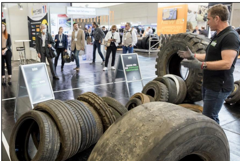
Bild 4: Zertifizierte Altreifenentsorger (ZARE) führen gebrauchte Nfz-Reifen der bestmöglichen Weiterverwertung zu. Nicht mehr reparierbare oder runderneuerebare Reifen werden der umweltgerechten Verwertung zu wertvollen Sekundärrohstoffen und hochwertigen Recyclingprodukten zugeführt. Jede Tonne Altreifen, die umweltgerecht verwertet (und nicht verbrannt) wird, spart rund 700 kg CO 2 -Emissionen.