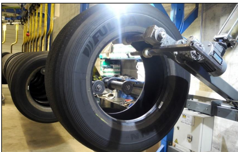
Bild 2: Für die Runderneuerung werden nur bestens geeignete Qualitätskarkassen verwendet. Die Karkassen werden akribisch geprüft – mit Shearografie, Röntgentechnik und visuellem Check. Nur Karkassen, die den hohen Qualitätsstandards entsprechen, werden für die Runderneuerung zugelassen und mit qualitativ hochwertigen Gummimischungen neu belegt.

Bild 1: In Europa runderneuerte Nfz-Reifen durchlaufen zahlreiche Sicherheits- und Qualitätskontrollen und erfüllen die hohen Anforderungen der ECE R109. Die Performance, die Runderneuerte auf die Straße bringen, ist absolut konkurrenzfähig. Die verfügbaren Profilvarianten decken alle typischen Einsatzbereiche und Achspositionen in den Segmenten Bus, Nutzlast-Verkehr und Baustelleneinsatz ab.