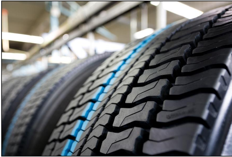
Bild 1: In Europa runderneuerte Nfz-Reifen durchlaufen zahlreiche Sicherheits- und Qualitätskontrollen und erfüllen die hohen Anforderungen der ECE R109. Die Performance, die Runderneuerte auf die Straße bringen, ist absolut konkurrenzfähig. Die verfügbaren Profilvarianten decken alle typischen Einsatzbereiche und Achspositionen in den Segmenten Bus, Nutzlast-Verkehr und Baustelleneinsatz ab.

Bildmaterial zur freien Verwendung in der redaktionellen Berichterstattung mit Angabe der Bildquelle.