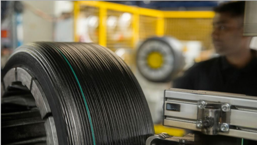
Bild 4 : Bei der Runderneuerung werden von Reifen Hinghaus mit modernster Technologie nur die Laufflächen und Seitenwände abgefahrener Reifen erneuert. Dabei kommen saisonal optimierte Gummimischungen hoher Qualität zum Einsatz. Die Profile runderneuerter Premium-Reifen der Marke King-Meiler für Pkw, SUV und LLkw entsprechen denen von Neureifen.