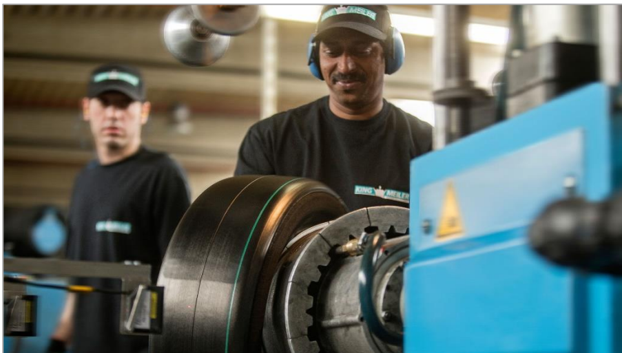
Bild 3: Runderneuerte Premiumreifen der Marke King-Meiler eignen sich mit asymmetrischem Profil für Pkw der Mittelklasse. Die Hochleistungsreifen haben als erste Runderneuerte die B-Kennzeichnung für Nasshaftung und den Rollwiderstand erreicht. In puncto Geräuschentwicklung erreichen die Runderneuerten niedrige 70 dB. Die Zulassung für Geschwindigkeiten bis zu 270 km/h verleiht hohe Sicherheit.