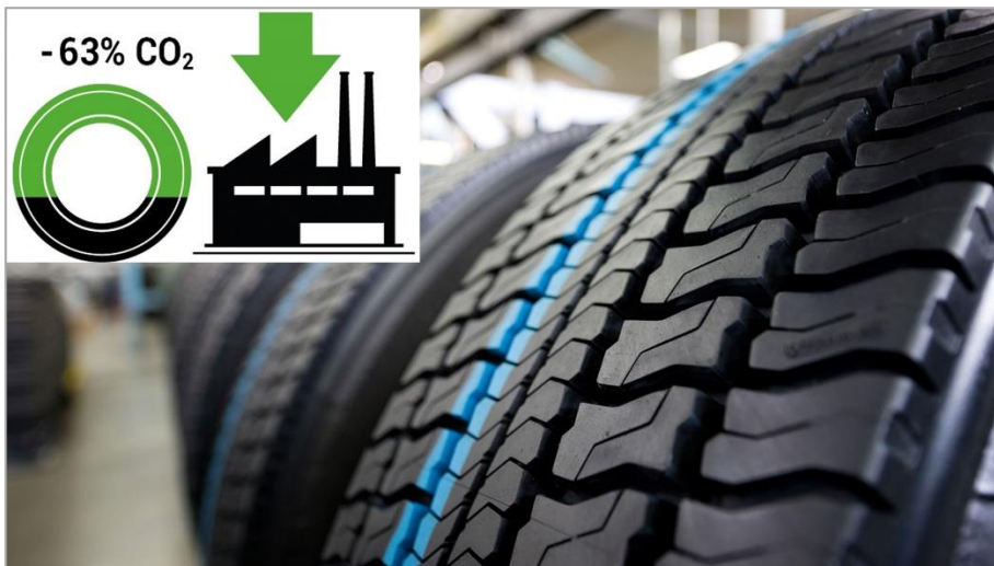
Bild 2: Nach einer AZuR/DBU-Studie des Fraunhofer-Instituts UMSICHT spart die Runderneuerung im Vergleich zur Neureifenherstellung rund zwei Drittel der Rohstoffe (vor allem Kautschuk), über 60 Prozent CO 2 -Emissionen, rund 50 Prozent Energie und beträchtliche Mengen Abfälle.