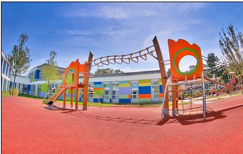
Bild 4: Aus Altreifen umweltgerecht recyceltes Gummigranulat ist ein wertvoller Sekundärrohstoff für eine große Bandbreite nachhaltiger, langlebiger Produkte. Das Spektrum reicht von elastischen Böden für Spielplätze und Sportplätze über Bautenschutzmatte für Dachbegrünung und Photovoltaikanlagen bis zu gummi-modifiziertem Lärmschutz-Asphalt. Pro Tonne Altreifen, die stofflich verwertet und nicht verbrannt wird, können rund 700 kg CO 2 -Emissionen eingespart werden.