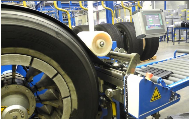
Abbildung 3: Professionell runderneuerte Reifen haben bei identischem Rollwiderstand und vergleichbarer Laufleistung klare ökologische Vorteile gegenüber Neureifen – in der Fertigung verursachen Runderneuerte über 63 Prozent weniger CO 2 -Emissionen und benötigen rund zwei Drittel weniger Rohstoffe 3 .